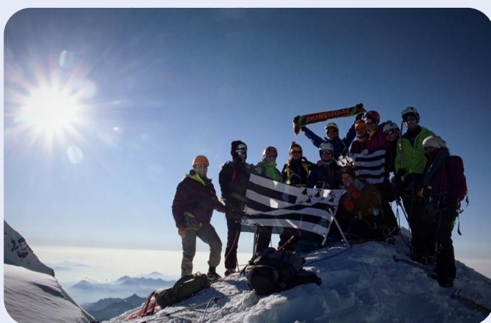
Étudiants Ambition Mont-Blanc 2016

Projet porté par l'Association Rennaise des Étudiants en Science Politique ( ARESP ) depuis sa création en 2013.